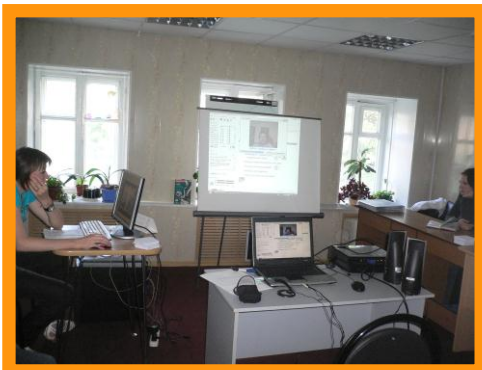
Обучение в форме вебинара

За 22 года работы "Российский фонд милосердия и здоровья" реализовал более 20 социально направленных программ, благодаря которым получили помощь более 65 тысяч опекаемых.