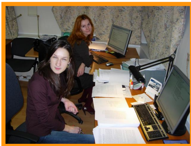
В редакционном отделе

НП «Рукописные памятники Древней Руси» признательно программе «инфоДонор» за оказанное содействие в предоставлении лицензионного программного обеспечения по льготным ценам, что позволило устранить многие проблемы, лучше организовать работу Партнерства и направить сэкономленные средства на свою основную деятельность, связанную с изучением, сохранением и популяризацией рукописного наследия Древней Руси.